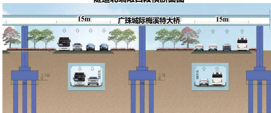
隧道下穿城际高架横断面图