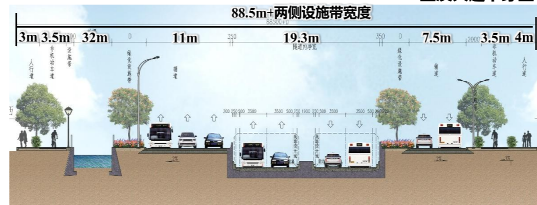
隧道北端敞口段横断面图