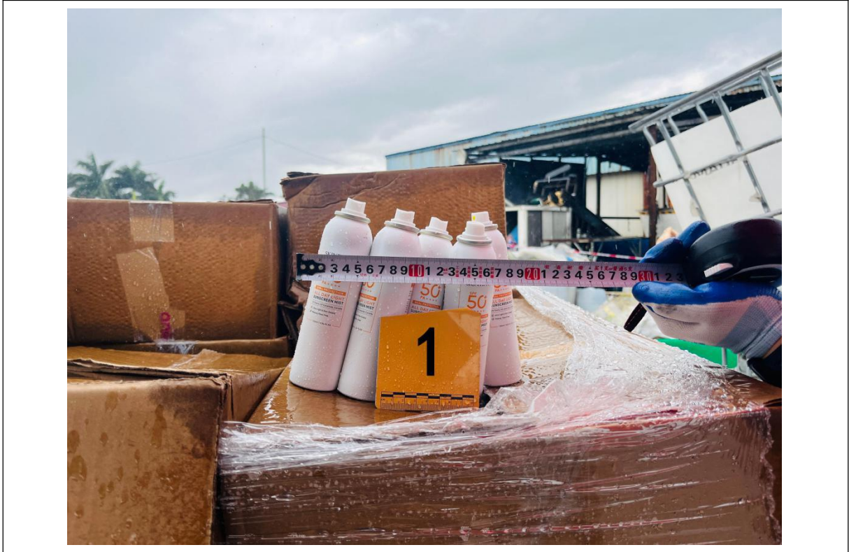
图 1: SKINTIFIC 字样的防晒喷雾铝瓶