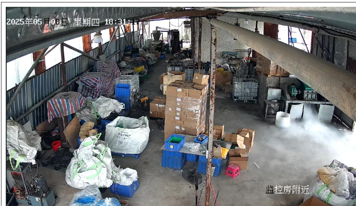
图3：破碎过程中出料口不断出现大量白色烟雾