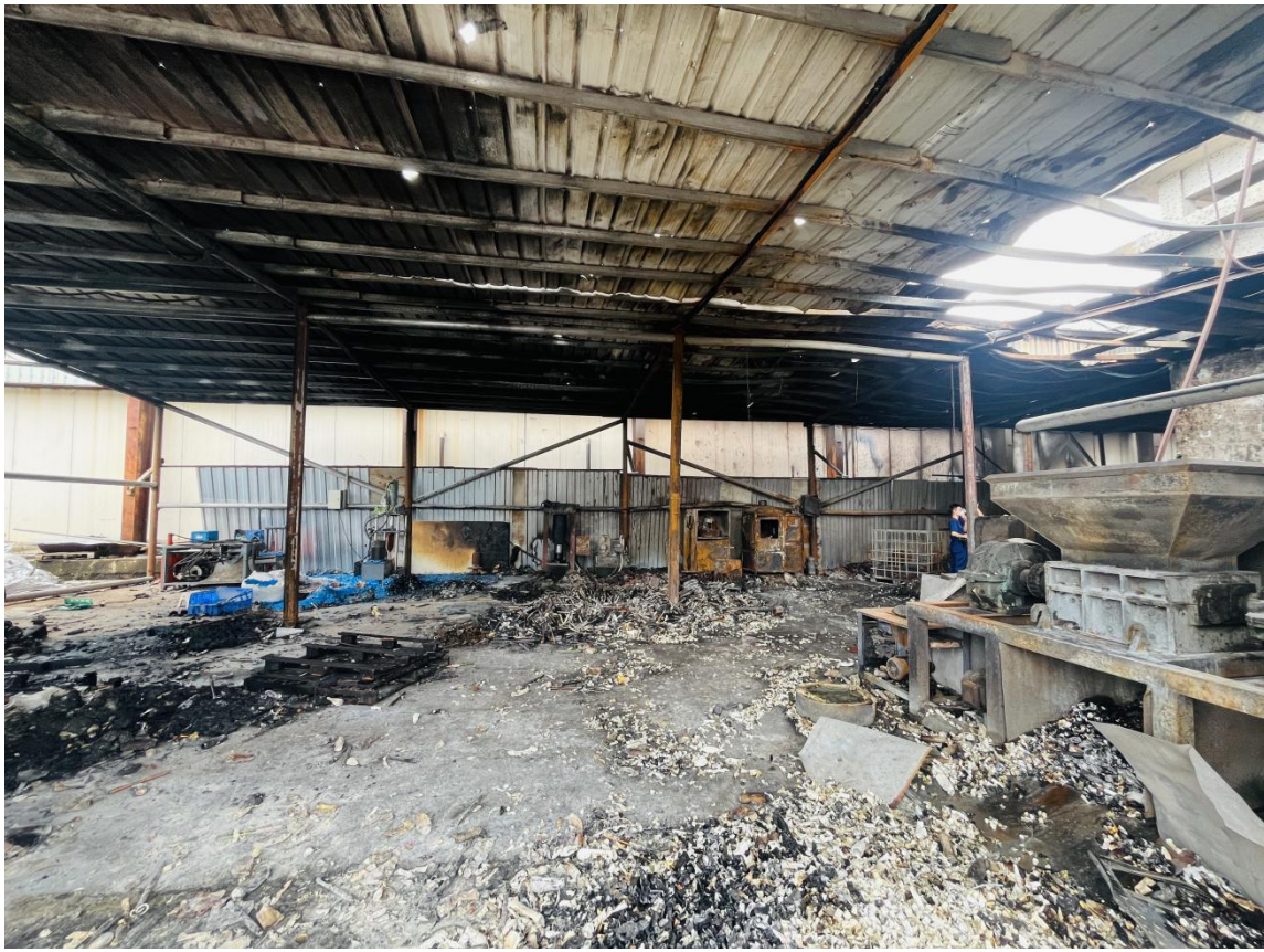
图7 事发后碎料房内部情况