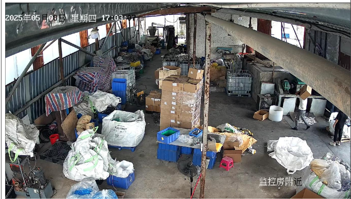
图 2: 侯志明将一箱防晒喷雾铝瓶搬入碎料房准备开始破碎作业