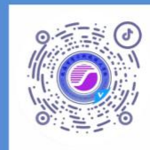
扫码观看索卡抖音号