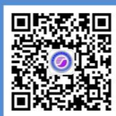
扫码查看索卡公众号

🚗 交通路线：乘坐珠海市k7/204/502/540/812/826-2路公交车到西海岸花园下车，向北前行300米。