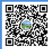
扫码查看索卡视频号