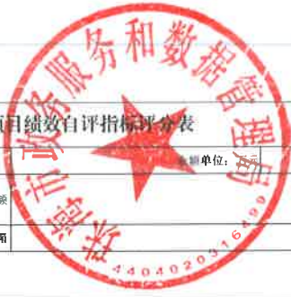
2023年项目绩效自评指标评分表