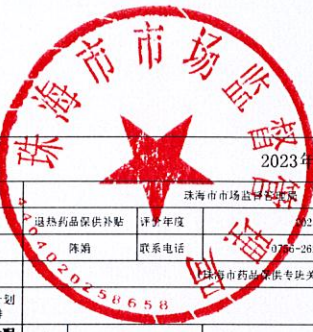
2023年项目绩效自评指标评分表