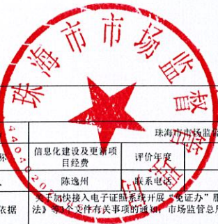
2023年项目绩效自评指标评分表