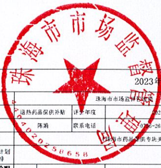
2023年项目绩效自评指标评分表